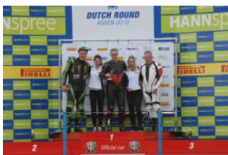
Links: Podium C-Competitie tot 600cc