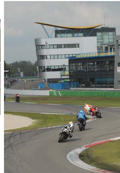
Door de GT Bocht.