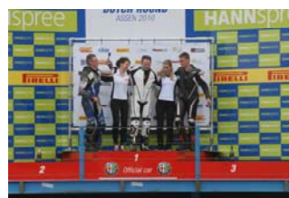
Rechts: Podium boven 600cc